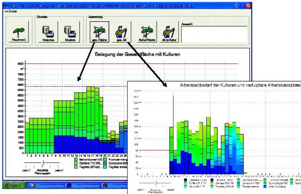
Abb. 2: Visualisierung der Flächenbelegung und Arbeitskräfteauslastung im Betrieb