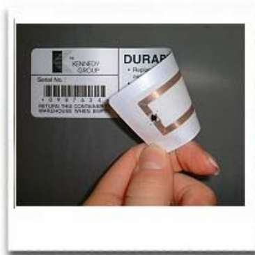
Abbildung 2: RFID-Chip