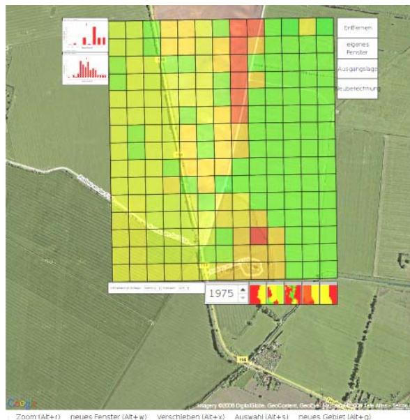
Abbildung 2: Grundwasserneubildung in einem Gebiet nahe Prenzlau