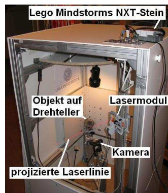
Abbildung 1: Messstand

In einer Voruntersuchung [Nie10] wurden Einflussfaktoren auf die Genauigkeit des Scan-Systems ermittelt und mit Hilfe eines an der Professur entwickelten Messstands größtenteils ausgeschaltet. In Abbildung 1 sieht man das Lasermodul an einem Schwenkarm per Servomotor sowohl verschiebbar als auch drehbar befestigt. Der Schwenkarm kann zudem per Servomotor um ca. 80° verschwenkt werden. Das Lasermodul ist somit in jede gewünschte Lage innerhalb des Messstands verschiebbar. Die Kamera und der Kalibrierhintergrund sind für eine stabile Aufnahmeszenarie statisch montiert. Für verschiedene Scanobjekte lassen sich die Komponenten manuell lösen und individuell verschieben. Das Objekt selbst steht auf einem per Motor drehbar gelagertem Teller. Nach jedem Teilschan kann das Objekt um einen gewünschten Winkel weiter gedreht werden. Der Mikrocomputer (NXT-Stein) von Lego Mindstorms steuert