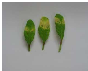
Bild 1: Farbliche Veränderung der Blätter durch Befall von Bakterien

Der Befall von Pflanzen durch schädliche Organismen ist häufig durch Farbveränderungen der Blätter gekennzeichnet.